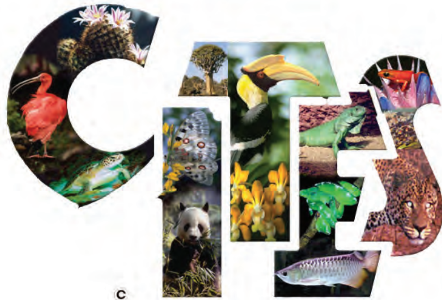
Convención sobre el Comercio Internacional de Especies Amenazadas de Fauna y Flora Silvestres

Este documento ha sido posible gracias al apoyo del Gobierno de los Estados Unidos, a través de la Agencia de los Estados Unidos para el Desarrollo Internacional (USAID) y el Departamento del Interior (USDOI). Los puntos de vista/opiniones aquí expresados no reflejan necesariamente los de USAID, el USDOI o los del Gobierno de los Estados Unidos.